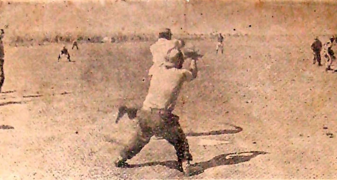
En las horas libres, practican deportes. Uno de los preferidos, es la pelota. Recientemente cuarenta y dos miembros de las UMAP fueron trasladados a un curso de instructores deportivos.