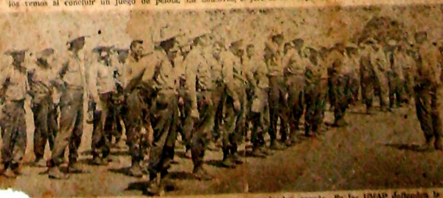
Militares de Ayuda a la Producción se crearon en noviembre pasado. En las UMAP defendemos la Patria, aumentamos la producción, particularmente la agrícola.