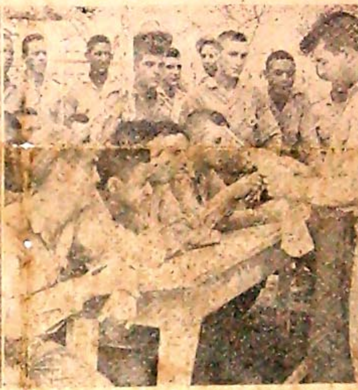
Las Compañías cuentan con la asistencia médica necesaria. En el campamento, en Camagüey —donde se encuentran hasta ahora estas unidades—, tienen todo lo que requieren. En las UMAP se ingresa por los llamados al SMO. Sus integrantes visten el uniforme del SMO y su disciplina es la misma. La prensa la leen en forma de círculos de estudio.